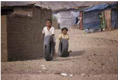
Dos hermanos jugando con ruedas en el barrio desértico de Las Palmeras, (Perú).