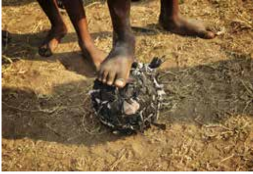
Junto a su balón fabricado con bolsas de basura. Kinshasa, (R. D. del Congo).