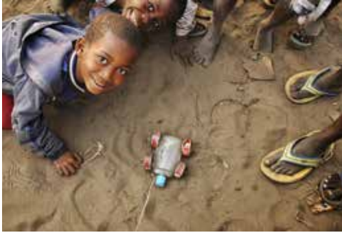
Asombrados de que desee fotografiar sus juguetes. Kinshasa, (R. D. del Congo).