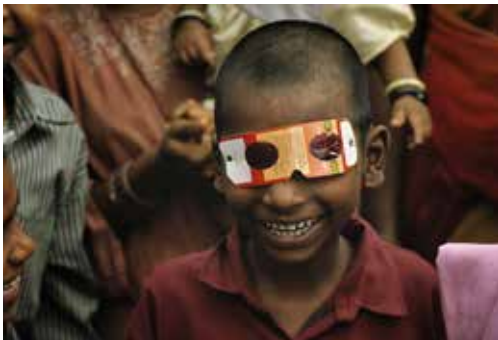
Un niño con sus gafas de cartón. Mumbai, (India).