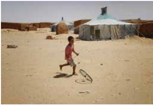
Campamento de refugiados saharauis. Zug de Auserd, (Argelia).