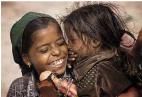
Dos niñas se divierten junto al lavadero de un río. Anantapur, (India).