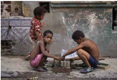
Niños jugando con las piezas de una radio. La Habana, Cuba.