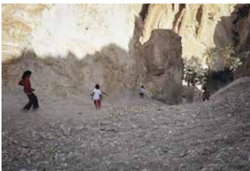
Juegan deslizándose por el desfiladero de rocas. Chebika, (Túnez).