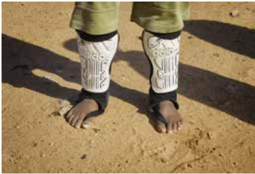
Máxima protección. Campamento Zug de Auserd, (Argelia).