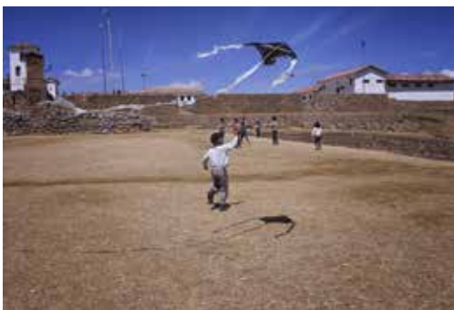
Un grupo de niños jugando con cometas construidas por ellos mismos. Chinchero, (Perú).