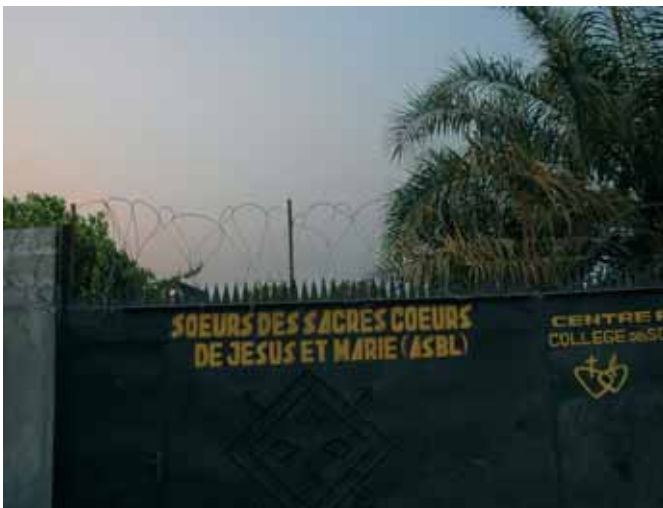
Puerta de entrada de una de las comunidades religiosas en Kinshasa, protegida con pinchos de metal, cristales y alambradas de púas.

“A las tres de la madrugada me despiertan los gritos desesperados de varias mujeres. Nunca había escuchado algo tan desgarrador”