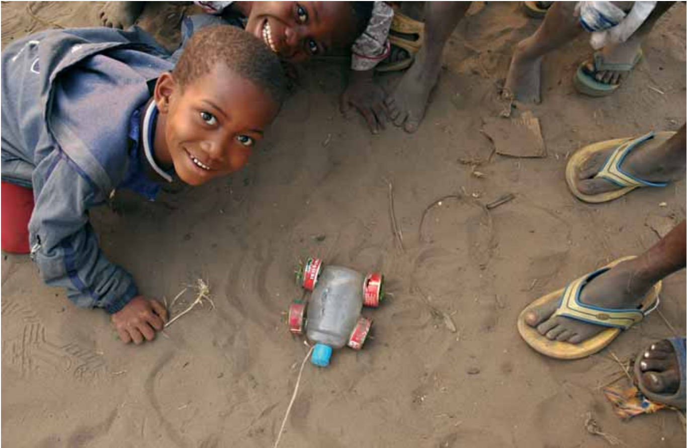
Varios niños se agolpan y se ríen sorprendidos de mi deseo por fotografiar sus creativos juguetes.

➤ grande de África. En su subsuelo se esconden ricos recursos naturales tales como diamantes, oro, cobalto, cobre o coltán (mineral de alta conductividad muy utilizado en la industria electrónica). Y es que Kinshasa puede presumir de algo: tiene el mayor despliegue en el mundo de soldados de la ONU: 20.000 soldados que se atrincheran en espera, en las inmediaciones del aeropuerto. Si a esto le sumamos los miles de soldados adolescentes del gobierno, unas infraestructuras maltrechas de agua y luz, corrupción en una democracia teatralizada, su largo historial de guerras y dictaduras y una pobreza acumulativa, tenemos una población sumida en una olla exprés que puede estallar en cualquier momento. Las elecciones aplazadas y todavía sin fecha de una población sin pensar, puede convertirse en detonante.