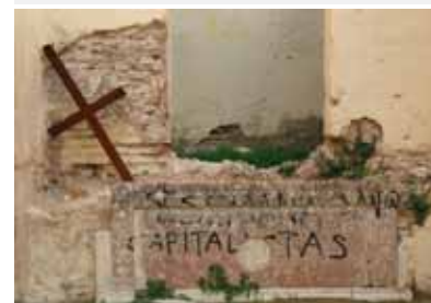
Pintadas sobre el altar y en las paredes de la ermita de Loja (Granada).

En noviembre de 2005 la Guardia Civil recuperó más de 20.000 piezas expoliadas en la provincia de Cuenca