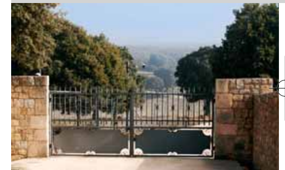
Una finca particular con cámaras de vigilancia en cuyo interior se encuentra la ermita románica de San Quirce (Burgos). Abajo, la iglesia en ruinas de Mota del Marqués (Valladolid).