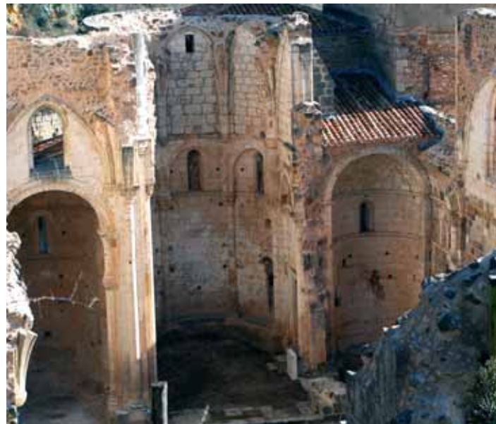
Arriba el monasterio de San Pedro de Arlanza (Burgos). En el centro el monasterio carmelita del Desierto de las Palmas de Benicasim (Castellón). Abajo la ermita de Hontoria de la Cantera (Burgos). En la página de la derecha una nave agrícola aprovechando el muro del monasterio de Villamayor de Treviño (Burgos).

Continuando por la misma carretera, en un radio de tan sólo 40 km en dirección Burgos, me van salpicando las ruinas de ocho monumentos: un monasterio, un castillo y varias iglesias y ermitas. En el Alto Aragón podemos citar una larga lista de pueblos que son testigos del agonizar de sus iglesias y monasterios: Abós, Acín de Garcipollera, Alquezar, Anzano-ii, Arasilla, Arguis-soldevilla, Bastarás, Belsué-santa maría, Bentué de nocito, Berbegal-santa águeda, Besians-san Juan, Bolea- Mue-ras, Bujaruelo - San Nicolas, Can de Used, Guar-ga, Ceresa-San Pelay, el Almerge, el Bayo, el Frago-San Miguel de Cheula, el Tormi-llo-Santiago, Escó, Espierre-Santa María, Fabana, Fuencalderas-San Miguel de Liso, Gavín- en Sabi-ñánigo, Gavín-San Pelay, Huérta-lo, Jánovas en Fiscal, Junzano-Sa-lillas, San Lorenzo, Ma-sadera, Larrosa de Garcipollera, Laveli-