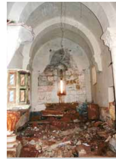
Iglesia en ruinas con capiteles y canecillos románicos. Albacastro (Palencia).

► El todo vale de la construcción. Determinados planes urbanísticos, piedras de sillería reutilizadas en la construcción de nuevas viviendas, la instalación de carteles publicitarios, cableado, antenas y aparatos de aire acondicionado en edificios