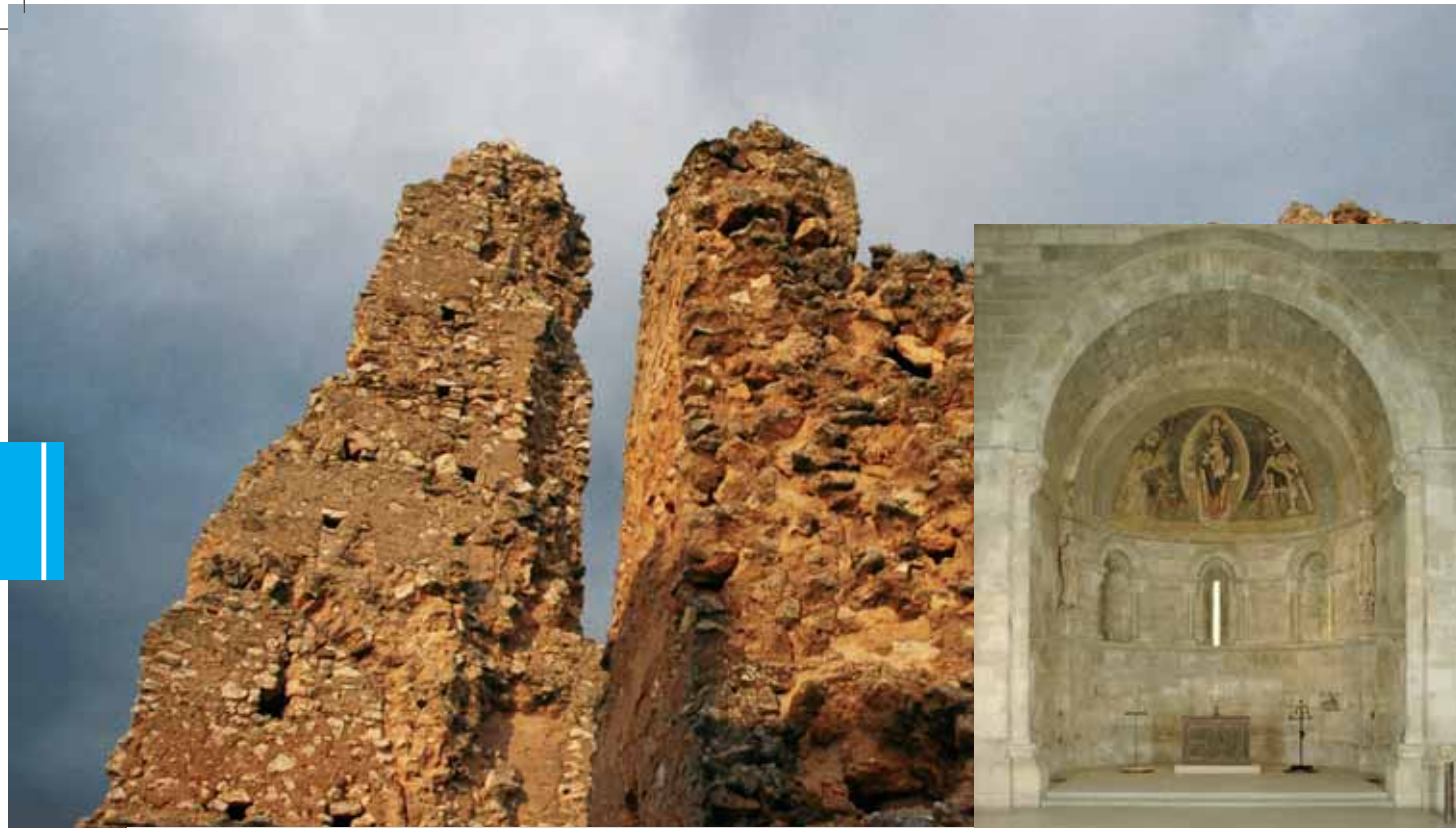
Ruinas de la iglesia de San Martín de Fuentidueña (Segovia) y su claustro original que se encuentra actualmente en el Museo de los Claustros The Cloisters del Museo Metropolitano de Nueva York.

das en la antigua fortaleza templaria de Villavieja (León) y lo mismo ha sucedido en la villa romana de Quintana del Marco (León) destruida en parte también por la concentración parcelaria. En noviembre de 2005 la Guardia Civil recuperó más de 20.000 piezas arqueológicas expoliadas en la provincia de Cuenca.