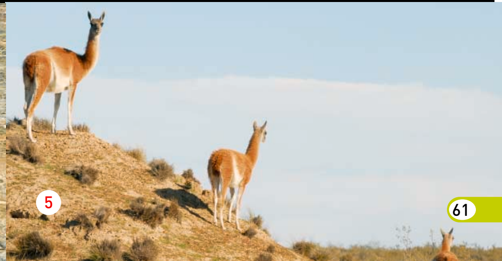
↑ 1- Salto de una ballena Franca Austral. 2- Paisaje del Parque Nacional de Ushuaia. 3- Cormoran roquero en pleno vuelo. 4- Atardecer en la Patagonia. 5- Un grupo de Guanacos 6- Una pareja de Cóndores (el ave más grande del planeta) en su nido.