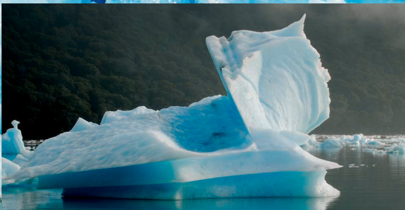
↑ Tempano desprendido del glaciar Upsala . → Pared del glaciar Spegazzini .

Texto y fotos: Siro López / www.sirolopez.com / expo@sirolopez.com